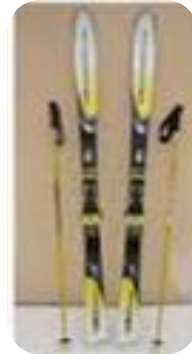
Ski années 2000