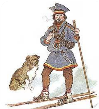
Skieur lapon gardant son troupeau de rennes

Les Lapons se servaient quant à eux des skis pour poursuivre les troupeaux sur les grandes étendues de neige.