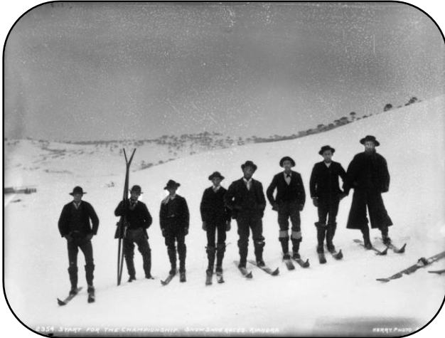
Les débuts du ski

L'origine du mot « ski » se retrouve dans les dialectes de nombreuses peuplades du nord de l'Europe et de l'Asie, avec des mots ayant la même racine linguistique pour désigner les skis : suski, suks, sok, suksildae... datant d'il y a plus de 10000 ans.