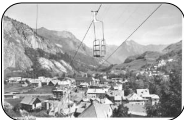
Télébenne Juliard à Valloire