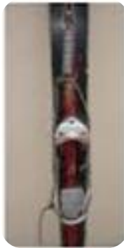
Fixation années 1950