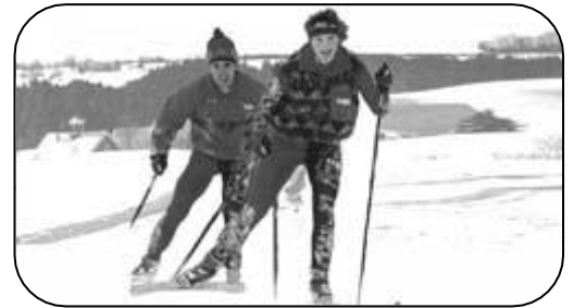
Course de ski nordique