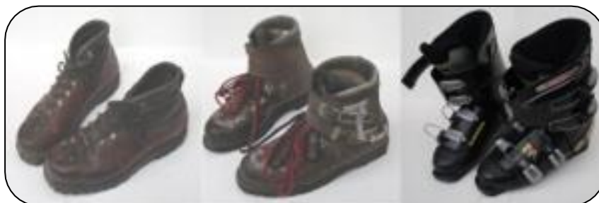
Évolution des chaussures de ski alpin

Les Jeux Olympiques de Grenoble en 1968 vont marquer l'apogée de l'industrie française du ski, avec Salomon, Dynamic et Rossignol qui ont mis au point l'essentiel du matériel que l'on utilise encore aujourd'hui.